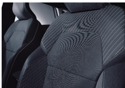
crna tkanina s prošivima – za INTENSE