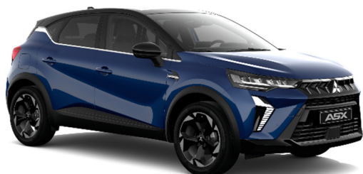
Plava Royal metalik (RQH, YNM*)