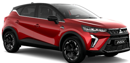
Crvena Sunrise biserna (NNP, XPA*)