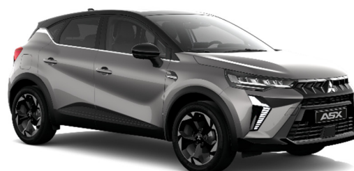
Siva Steel metalik (KNG, XNK*)