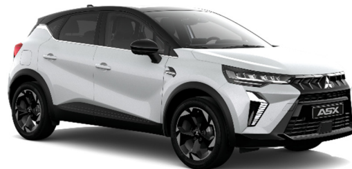
Bijela Crystal biserna (QNC, XUI*)