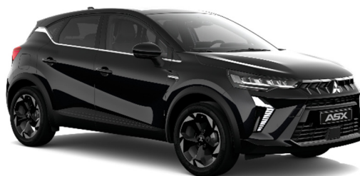
Crna Onyx metalik (GNE)

*Dvobojna karoserija s crnim krovom opcijski.