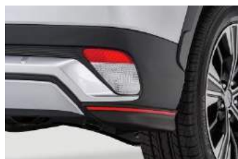
Kutni spojler straga