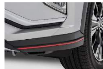
Kutni spojler sprijeda