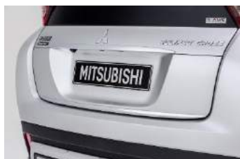
Ukrasna lajsna repnih vrata