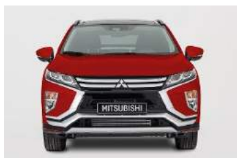
Dekoracija prednjeg odbojnika