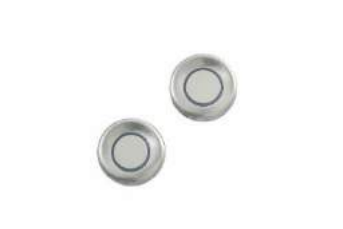
Parkirni senzori (sprijeda i straga)