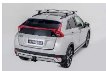
Poprečni krovni nosači