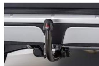
Kuka za vuču