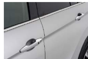
Kromirana obloga ručica vrata