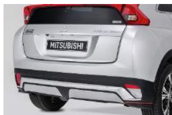
Dekoracija stražnjeg odbojnika