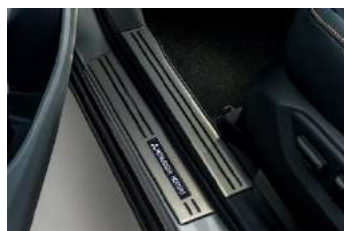
Zaštita praga prokrom LED