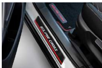
Zaštita praga karbon dizajn