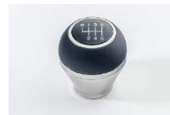
Ručica mjenjača 6MT