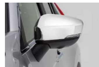
Kromirana obloga retrovizora