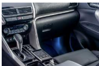
Iluminacija prostora za stopala