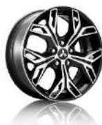
Naplatak od lake slitine strojno brušen