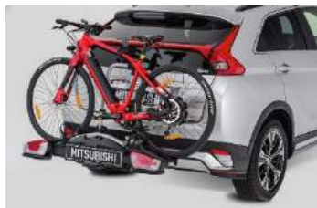
Nosač za bicikle (stražnji)