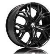
Naplatak od lake slitine crni