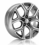
Naplatak 18" posebnog dizajna (dostupan u više nijansi)