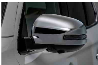
Pokrov retrovizora kromirani