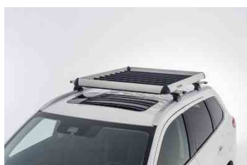
Krovna košara za prtljagu