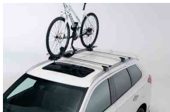
Krovni nosač za bicikl