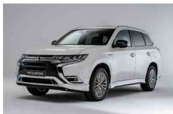
Prednji kutni defliektor (spojler)