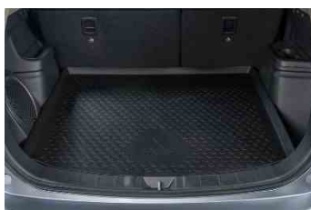
Gumena obloga podnice prtljažnika