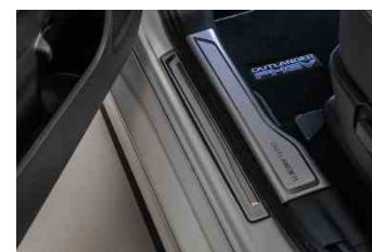
Dekorativna zaštita praga