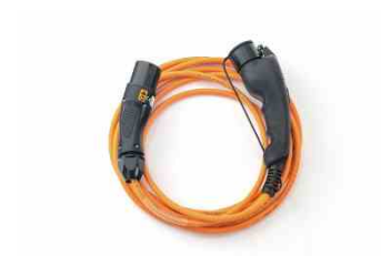
Mode 3 type 2 kabel za punjenje baterije (za javne punionice)