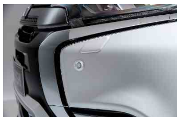
Prednji parkirni senzori