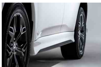
Bočni spojler (deflektor)