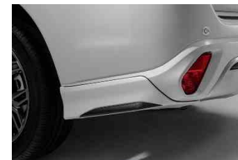
Stražnji kutni spojnik (defliektor)