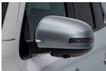
Pokrov retrovizora mat srebrni