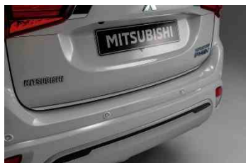
Dekoracija repnih vrata