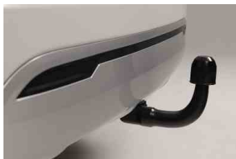
Kuka 7 PIN