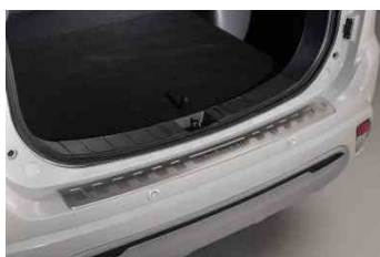
Zaštita stražnjeg branika (nehrđajući čelik)