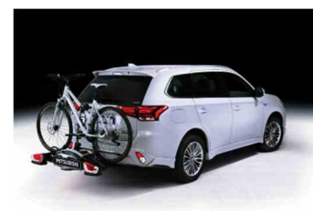
Repni nosač za bicikle